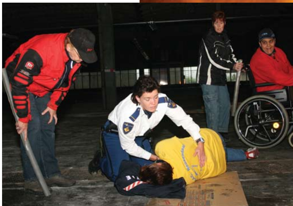
Foto rechts: De brandende brommer wordt geblust. Foto onder: slachtoffers worden onderzocht.

Jongeren op brommers crossen door een verlaten pand. Buren alarmeren de politie vanwege de geluidsoverlast. Zodra een politieteam arriveert, slaan de joyriders op de vlucht. Gevolgen: Een botsing... Een berijder wordt weggeslingerd en raakt gewond... Een brommer lekt vloeistof en vliegt in brand... Voorbijgangers mengen zich op indringende wijze in het voorval... Voldoende werk dus voor de verzamelde hulpdiensten.