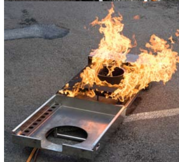
FireTrolley met simulatie van boven: vaste stofbrand en onder: vloeistofbrand