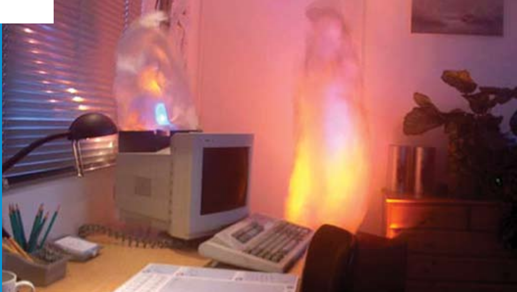
De oefenruimte van Corus.